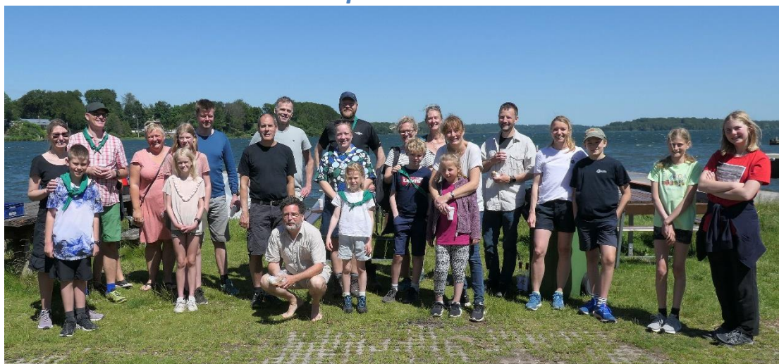
Samlet opstilling ved Furesøbadet i Farum. 2020

Gruppegåtur er hyggeligt samvær, og ruten er flot og rig på oplevelser