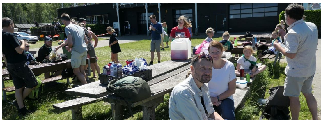
Pause med forplejning ved Furesøbadet – lækkert.

Holte Gruppe sørger for frokosten ved Furesøbadet og kaffe, te og sødt ved Frederiksdal og Fuglevad. Vandflaskerne kan fyldes op igen ved Furesøbadet, Frederiksdal og Fuglevad.