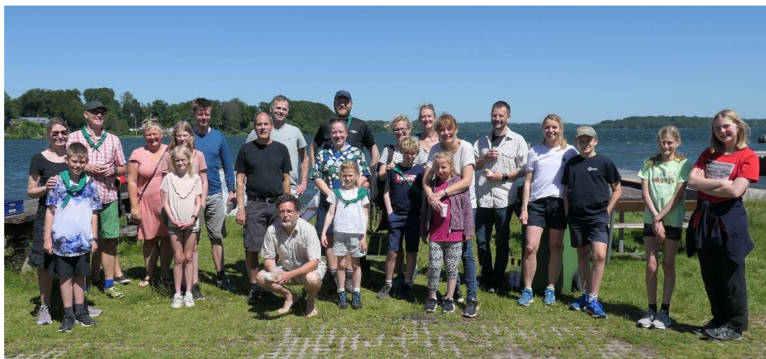
Samlet opstilling ved Furesøbadet i Farum. 2020

Gruppegåtur er hyggeligt samvær, og ruten er flot og rig på oplevelser